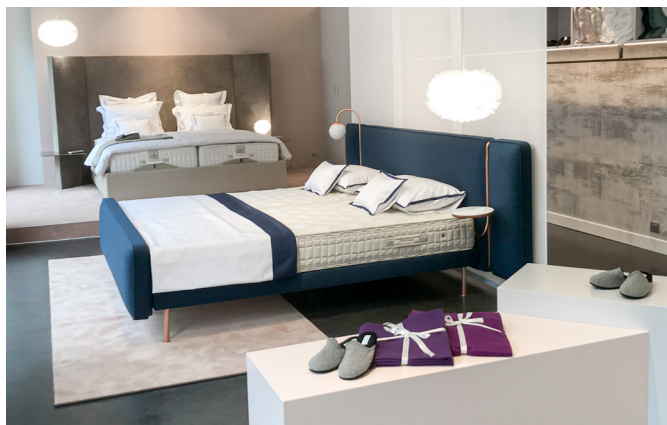
Elite Gallery Luzern

Individuelle Beratung und Kundennähe liegen Elite zu Herzen, daher vor kurzem die Neueröffnung von 2 Showrooms in Luzern und Gstaad. Zwei Gründe mehr, um uns besuchen zu kommen!