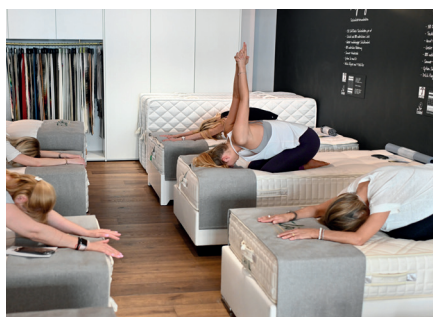
4. Die Kindshaltung