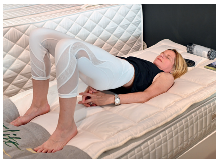
2. Die Schulterbrücke