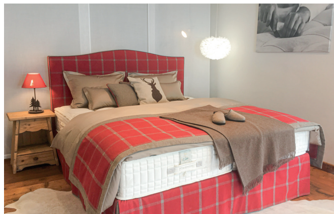
Elite Gallery Gstaad

Elites Luzerner Boutique liegt zentral in der Altstadt, mitten in der Einkaufszone. In Gstaad liegt sie im Dorfzentrum. Diese 2 neuen Räumlichkeiten, die der Schlafqualität und der Entspannung gewidmet sind, erweitern das Angebot der sechs bestehenden Boutiquen und verstärken Elites Präsenz auf dem Schweizer Markt.