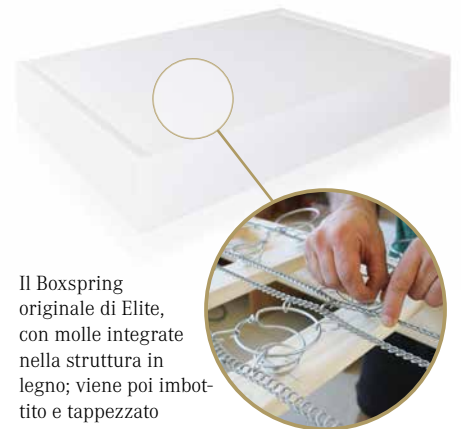
Il Boxspring originale di Elite, con molle integrate nella struttura in legno; viene poi imbottito e tappezzato

Dopo una decina d'anni, con il diffondersi di patologie dorsali sempre più acute, il Boxspring è stato riabilitato, e di nuovo abbinato al concetto di «ben dormire». Di conseguenza, alla luce di questa nuova