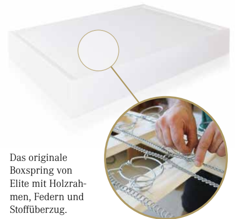
Das originale Boxspring von Elite mit Holzrahmen, Federn und Stoffüberzug.

Während der letzten zehn Jahre hat sich das Boxspringbett wieder an die Spitze zurückgekämpft - das wach-