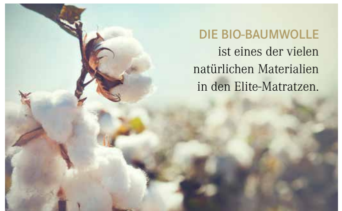
DIE BIO-BAUMWOLLE ist eines der vielen natürlichen Materialien in den Elite-Matratzen.

BETTUNTERGESTELL UND MATRATZE - ... sind ein Paar. Das alte Bestgestell behalten, verkürzt meist die Lebensdauer der neuen Matratze. Besser gleichzeitig das Bettgestell und die Matratze erneuern.