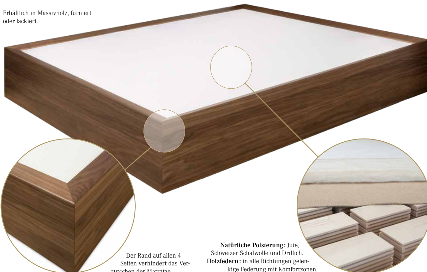
Der Rand auf allen 4 Seiten verhindert das Verrutschen der Matratze.

Erhältlich in Massivholz, furniert oder lackiert.